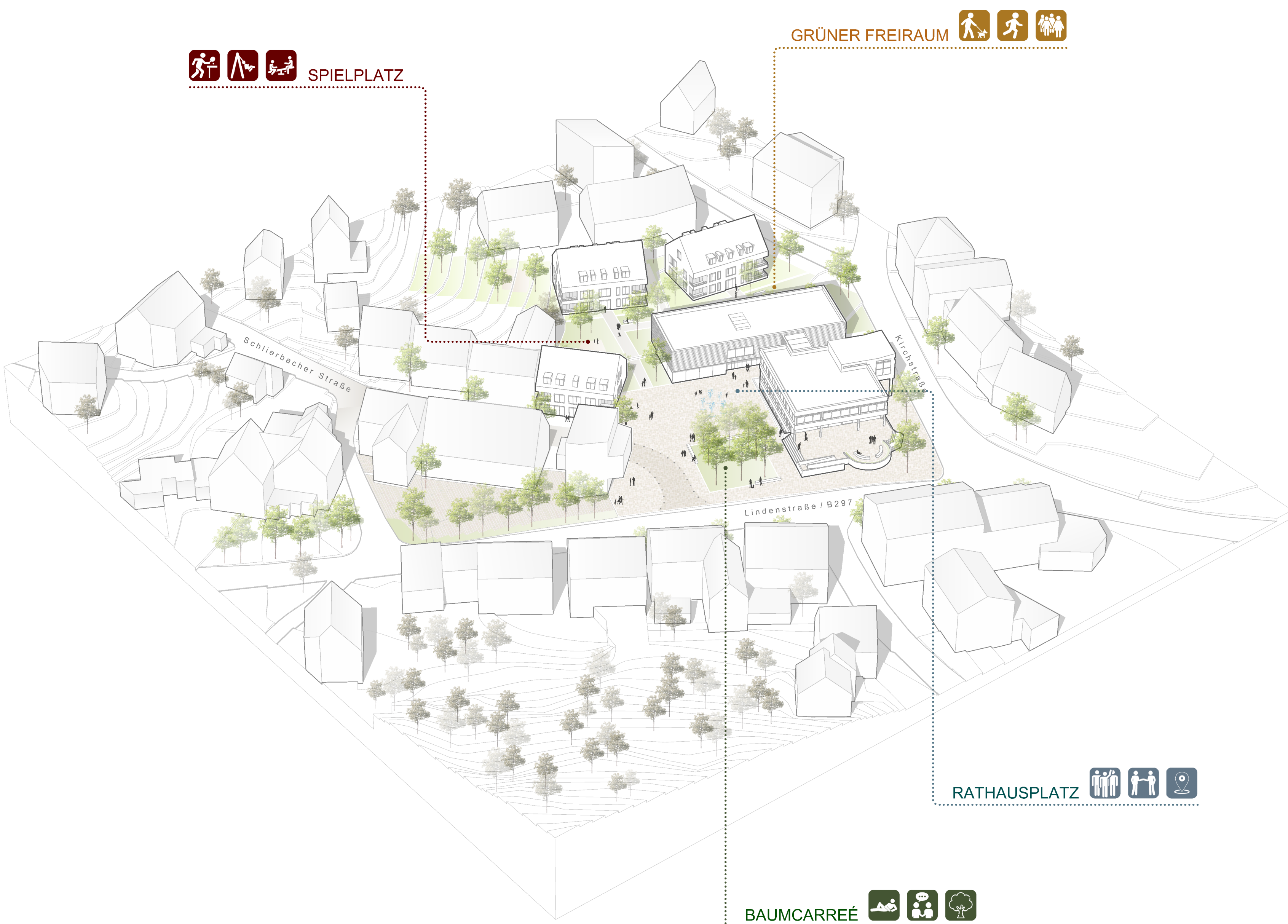
Perspektive II Stadträumlicher Zusammenhang

Im Norden werden entlang der Kirchstraße die gewünschten 6 PKW-Stellplätze mit E-Ladestation angeboten. Zusätzliche Stellplätze bieten ein oberirdisches Parkierungsangebot für Rathausbesucher und Bewohner der beiden geplanten Wohngebäude. Von der Kirchstraße aus wird auch der separate Nord-Eingang zum Rathaus und zur Bücherei im OG erschlossen. Fahrradstellplätze werden in der Nähe der Gebäudezugänge dezentral angeboten.