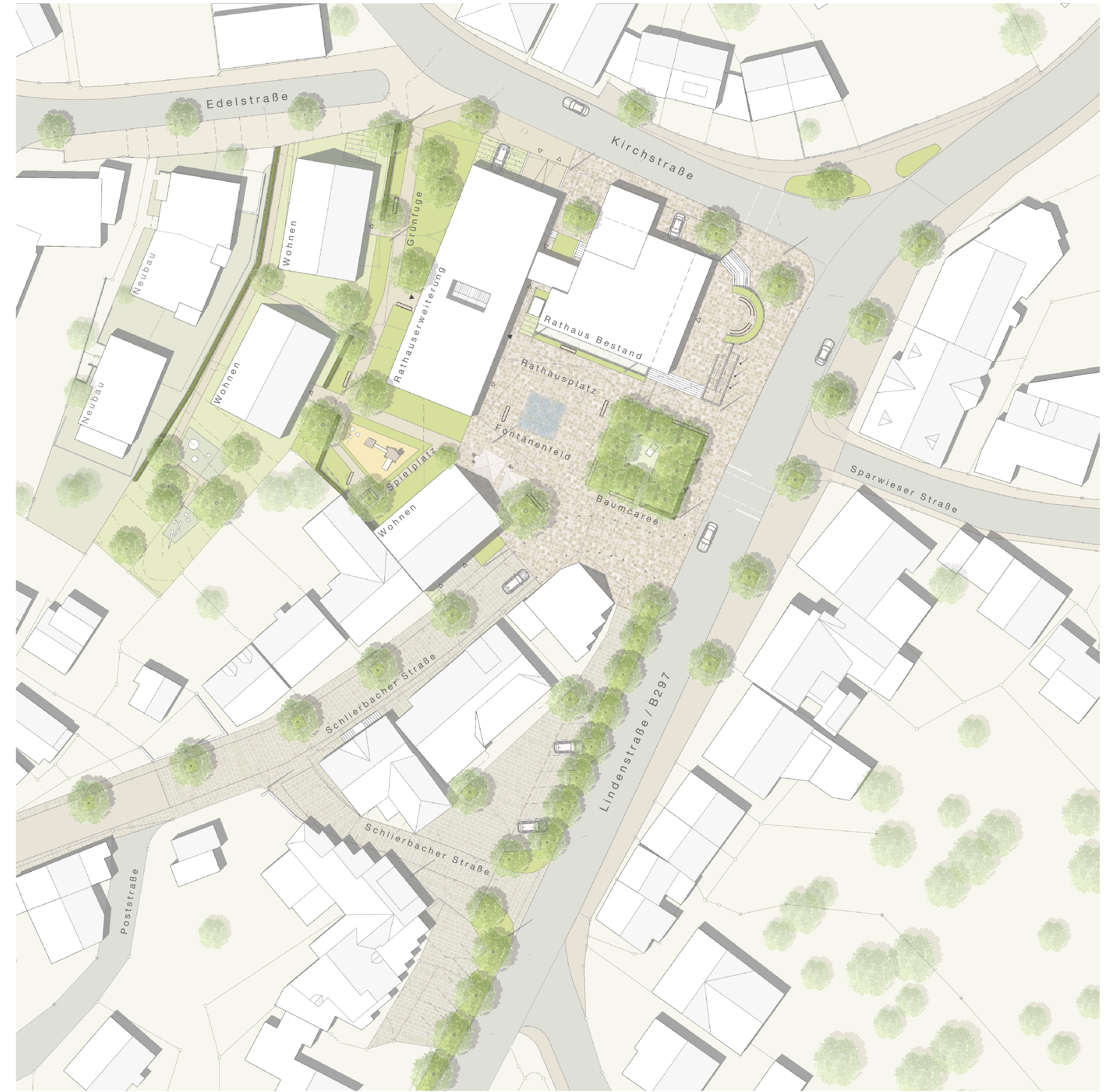
Lageplan 1 | 500

Die unpräzisen Erweiterung des Rathauses mit einem langgestreckten wie schmalen zweigeschossigen Baukörper an der westlichen Seite des Bestandes gelingt gleich zweierlei: stadträumlich bildet der Erweiterungsbau die westliche Raumkante des Rathausplatzes, die sich mit dem Haupteingang und der großzügigen Fassade des Sitzungssaals einladend zum Platz öffnet. Gleichzeitig gelingt ein einfacher wie störungsfreier Anschluss an den Bestand, der mit einem neuen Treppenhaus (mit integrierter Aufzugsanlage) als Scharnier zwischen Bestands- und Neubau die Barrierefreiheit in allen Bereichen des zukünftigen Rathauses sicherstellt.