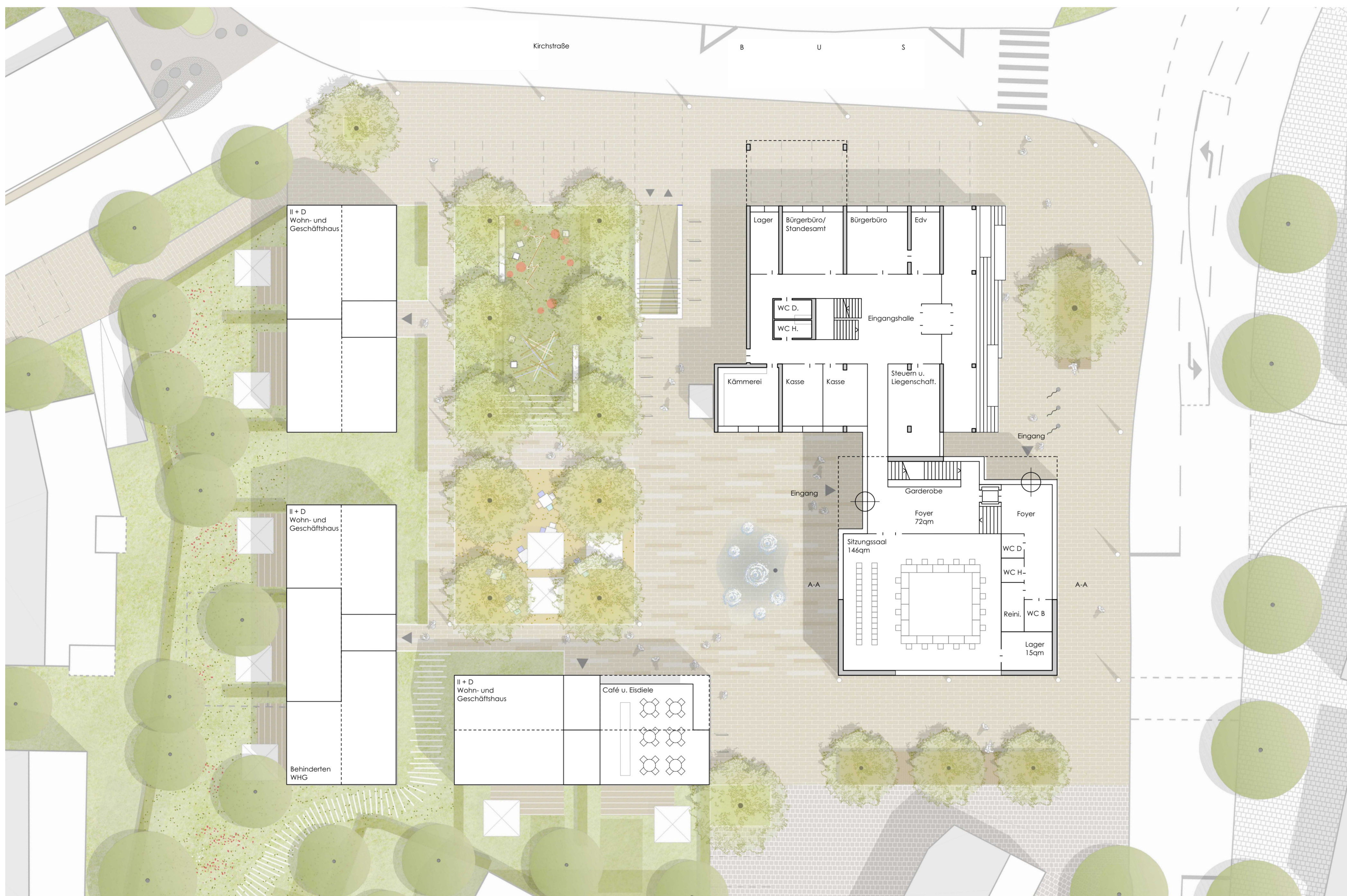
Grundriss Erdgeschoss M 1:200